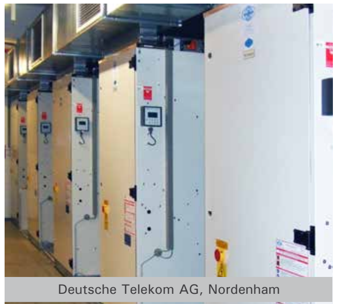
Deutsche Telekom AG, Nordenham