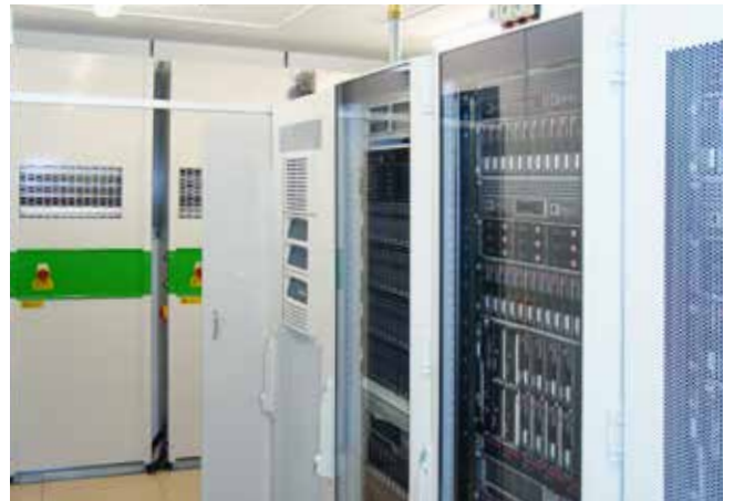
Mobiles Datacenter mit Slim Line Klimatisierung