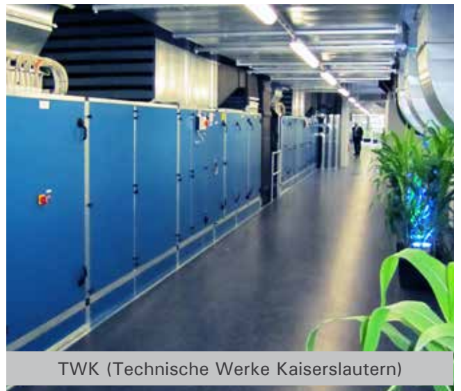
TWK (Technische Werke Kaiserslautern)