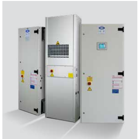
von links nach rechts: Slim Line Q7, Slim Line 7kW, Slim Line Q15

In Standardanwendungen können 80% der Betriebszeit mit Kühlung durch Außenluft bestritten werden, d.h. es arbeiten nur die Regelelektronik und energiesparende Ventilatoren, während der Kältekompressor als größter Verbraucher inaktiv bleibt.