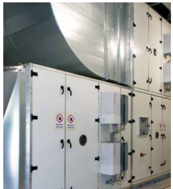
Free Line DV mit 70000 m 3 /h